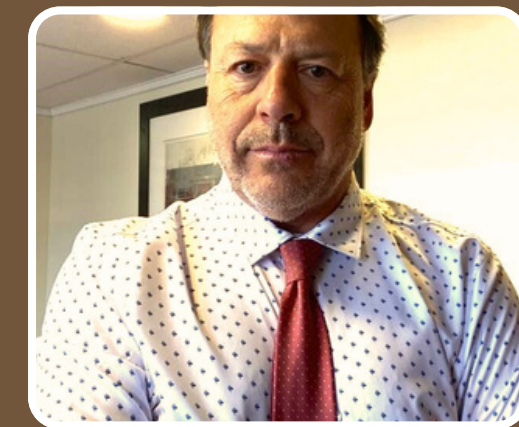
EQUIPO PROFESIONAL ABOGADOS Y EXPERTOS EN PREVENCIÓN DE RIESGOS